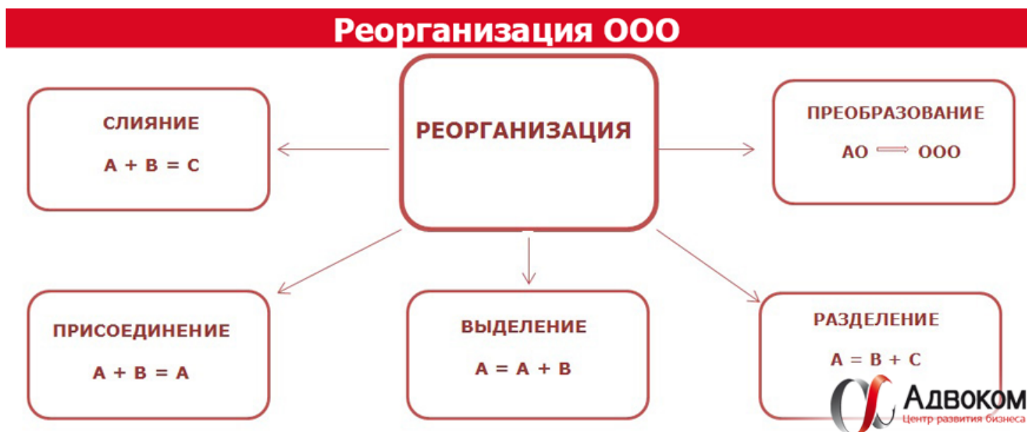
Рисунок 2. Схема видов реорганизации юридических лиц

Схематично виды реорганизации представлены на рисунке 2 [30]