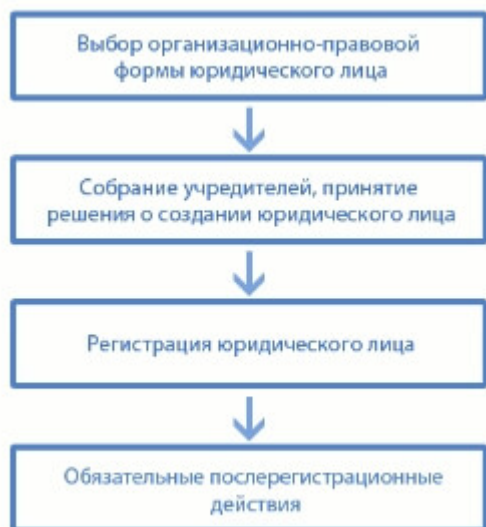
Рисунок 1. Схема создания юридического лица

Если создание юридического лица можно разбить на общие 4 этапа создания, то они будут выглядеть так, как представлено на рисунке 1.